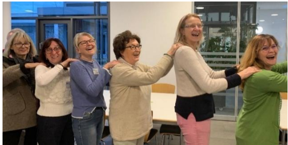
Nach der intensiven Probe am Vormittag, gönnten wir uns eine erholsame Rückenmassage beim Anstehen für das Mittagessen.

Alles in allem ein in jeder Hinsicht gelungenes Wochenende, das hoffentlich nicht zum letzten Mal stattfand.